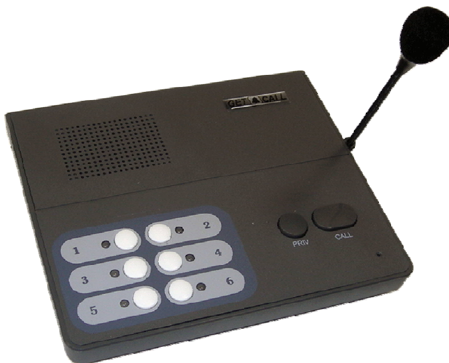
Рисунок 1. Внешний вид пульта GC-1006DG

Подключите штекер блока питания, входящего в комплект поставки, в разъем, расположенный на задней стороне пульта.