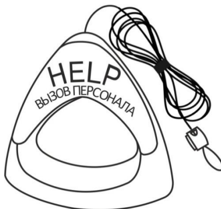
Рисунок 2. Дополнительная ручка со шнуром для кнопок вызова MP-060W1

При использовании кнопки вызова в душевой для МГН может понадобиться добавление к ней второго захвата (дополнительной ручки). Для этого используется дополнительная ручка красного цвета со шнуром красного цвета для кнопок вызова MP-060W1. Длина шнура - 1 м. Внешний вид дополнительной ручки со шнуром для кнопок вызова приведен на рис.2.