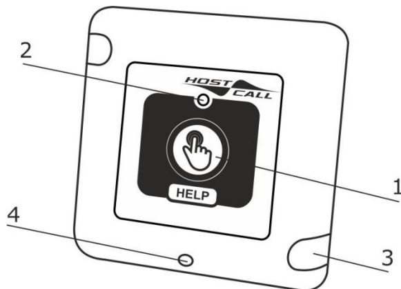
Рисунок 1. Внешний вид радиоадаптера сопряжения MP-413D1

На рис.1 приведен внешний вид радиоадаптера сопряжения.